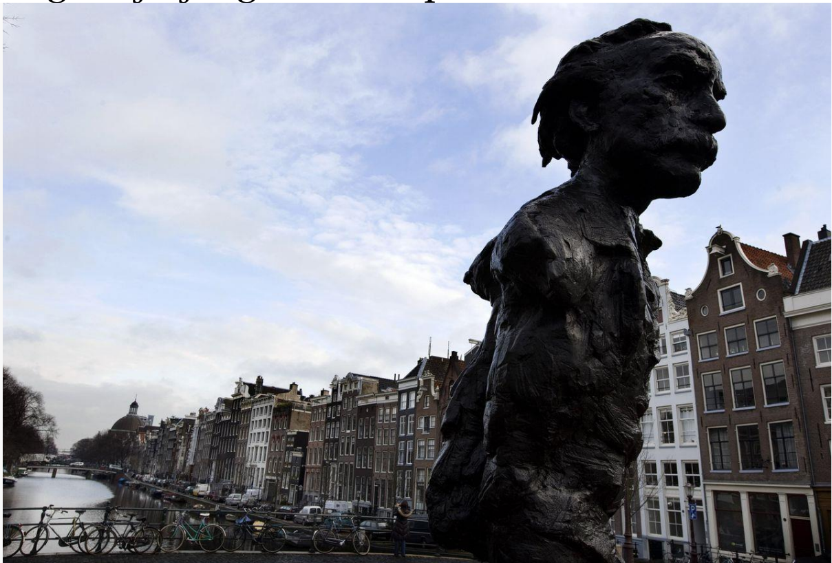
Beeld van Multatuli, in Amsterdam.